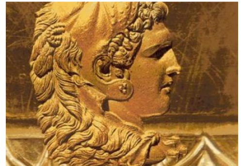
Filippi is genoemd naar koning Filippus van Macedonië. Zijn zoon was de bekende Alexander de Grote die een groot deel van de wereld veroverde.

We zien wel in Handelingen dat op zeker moment Lukas niet meer spreekt over Paulus en zijn metgezellen als "zij" maar Hand. 20 over "wij"; vanaf dat moment voegde Lukas zich dus bij het gezelschap van Paulus – nadat Paulus Macedonië voor de tweede keer doorreisde 2 Kor. 2:12,13 . Dit was ongeveer zes jaar nadat hij de gemeente had gesticht. Het verslag van Lukas wordt vanaf dat moment dan ook een 'ooggetuigenverslag' van de hand van Lukas.